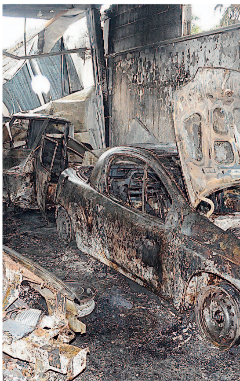
L'ATTENTATO Le conseguenze dell'incendio

L'incendio all'interno dell'officina ha provocato danni ingenti. Da un calcolo sommario, sono stati quantificati intorno ai 400mila euro.