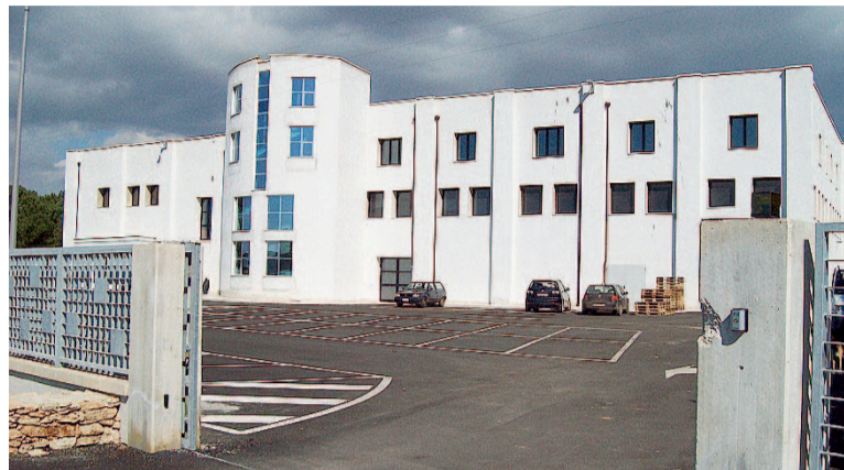
L'IDEA Lo strumento di sostegno finanziario progettato dalla Diocesi di Ugento. A sinistra l'auditorium di Alessano, dove vanno indirizzate le domande

Si punterà sul finanziamento non solo di iniziative individuali, ma anche di progetti presentati da più soggetti, finalizzati alla costituzione di cooperative soprattutto a carattere sociale. Il progetto verrà avviato subito dopo Pasqua, nella prima metà di aprile. Le istanze possono essere presentate al Centro servizi diocesano «Progetto Policoro», con sede nell'auditorium don Tonino Bello di Alessano, sulla statale 275 (tel. 0833784105). I contributi invece possono essere versati sul conto corrente postale 12647731 e sul conto corrente bancario IT40Y0358901600010570279252, entrambi intestati alla diocesi di Ugento.